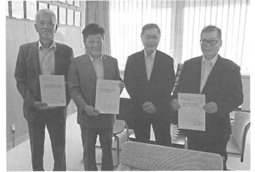
～大田3会の会長と大田区議会議長～