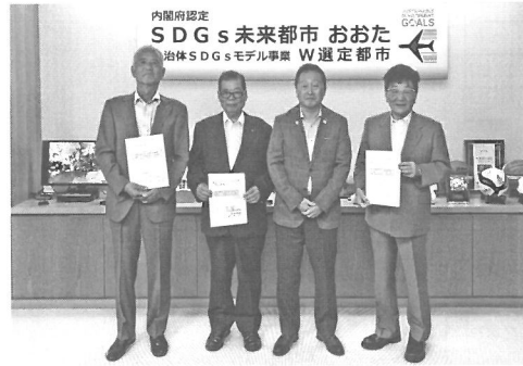
～大田3会の会長と大田区長～